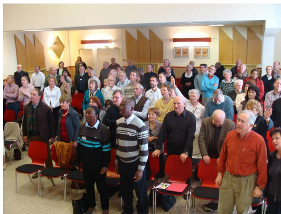
Convention de Dijon

violence, attaques, guerres.... ! Le monde est dans un mauvais état et on se demande comment cela se terminera. Toutefois, il y a une sortie, et c'est la véritable bonne nouvelle.