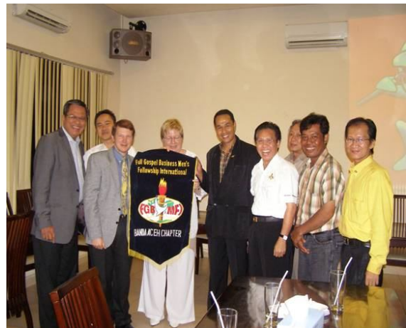
Réunion de chapitre à Jakarta

Nous avons été invités à nous joindre aux 30 jours de prières, 24/24, tenu dans un hôtel de la ville pour préparer les élections nationales du 9 avril. La salle était comble avec mille personnes présentes, élevant leurs voix vers Dieu pour prendre le contrôle sur ces élections. 44 partis participaient à ces élections, certains très extrémistes, et la présence policière augmentait de jour en jour.