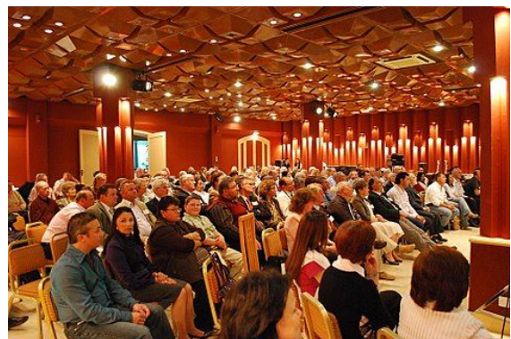
Une session de la conférence européenne à Malte

'Je joins un rapport sur ce qui s'est avéré une convention européenne remarquable.