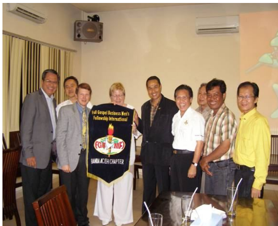
Chapter meeting in Jakarta