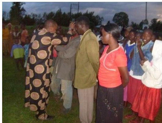
Biddend met de zieken in Kenia.