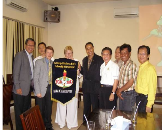
Capítulo reunión en Yakarta

personas, todos "en el fuego por el Señor", y muy influyentes en sus empresas de trabajo.