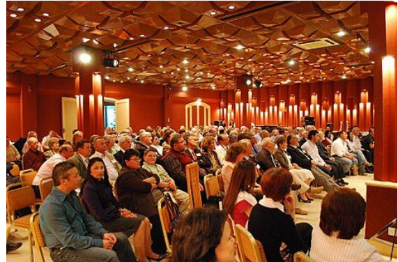
Un período de sesiones de la Conferencia Europea en Malta

"Adjunto un informe sobre lo que resultó ser una excelente Convención Europea.