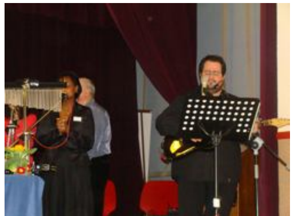
Convención de Dijon

violencia, ataques, guerras...El mundo está en mal estado y uno se pregunta cómo terminará esto. Sin embargo, existe una salida, y que es la verdadera buena noticia. La buena noticia es que Dios está ahí, invisible a los ojos, pero muy real. Él está interesado en los hombres, porque nos ama apasionadamente y él sólo tiene un deseo, para venir y salvar a todos los hombres y a la humanidad del mortal avispero en el que se perdió.